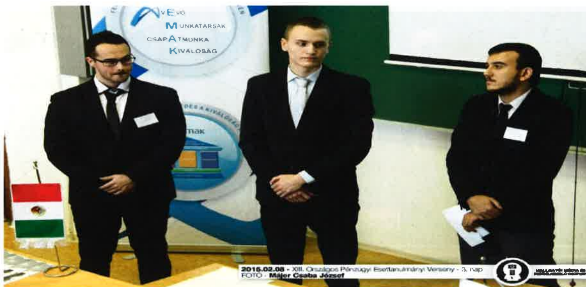
2015.02.08 - XIII. Országos Pénzügyi Esettanulmányi Verseny - 3. nap