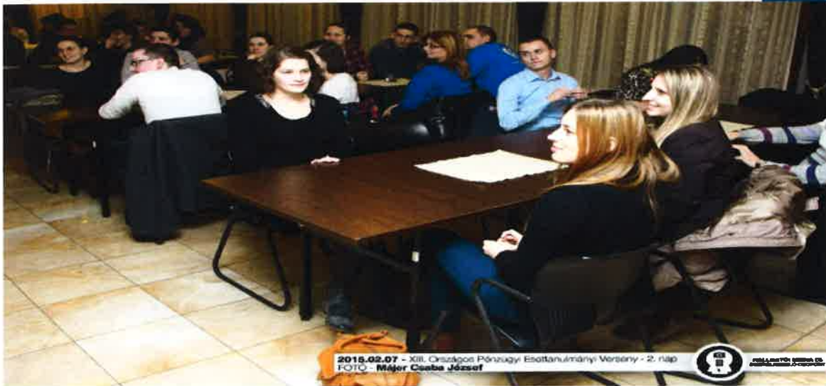
2015.02.07 - XIII. Országos Pénzügyi Esztanváltási Verseny - 2. nap