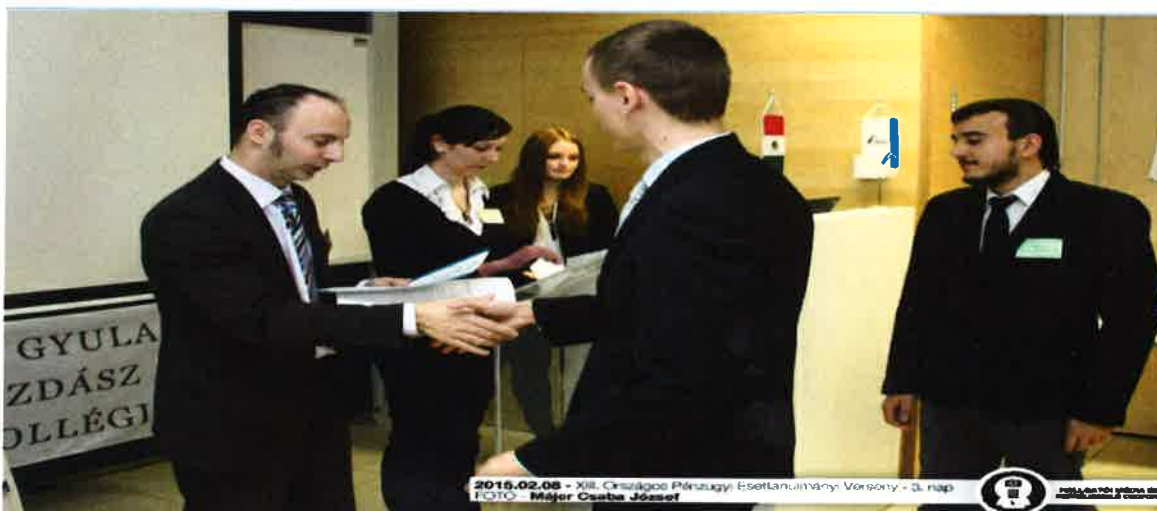
2016.02.08 - XII. Országos Pénzügyi Esettanulmányi Verseny - 3. nap

MAGYAR PÉNZÜGYI ÉS PÉNZÜGYES SZAKMUNKÁSOK PÁLYÁZAT-ÉRTÉKELÉSI BIZOTTSÁGA