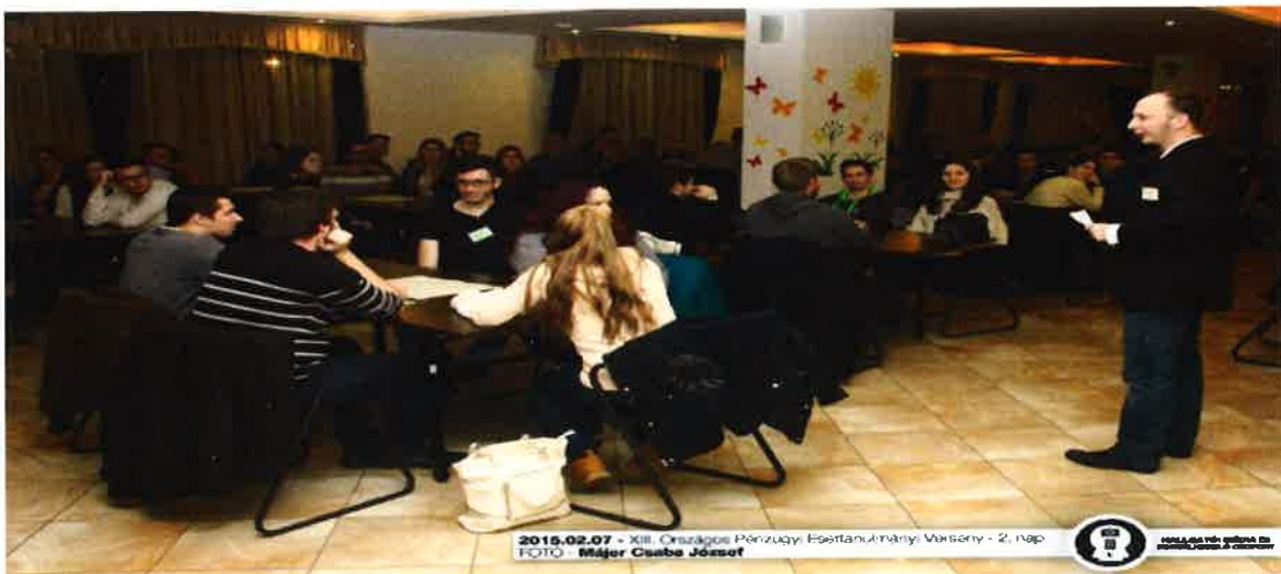
2015.02.07 - XIII. Országos Pénzügyi Esztanulmányi Verseny - 2. nap

PALLAS ATHÉNE DOMUS SCIENTIAE ALAPÍTVÁNY