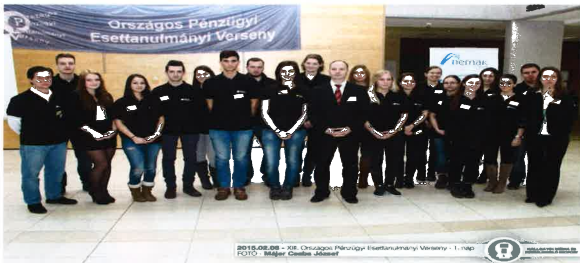
2015.02.06 - XIII. Országos Pénzügyi Esettanulmányi Verseny - 1. nap

MELLÉKLETI FOTÓK IS KÉRDÉS, VÁLASZ, VITACSA