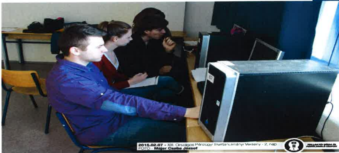
2015.02.07 - XIII. Országos Pénzügyi Esztanulmányi Verseny - 2. nap