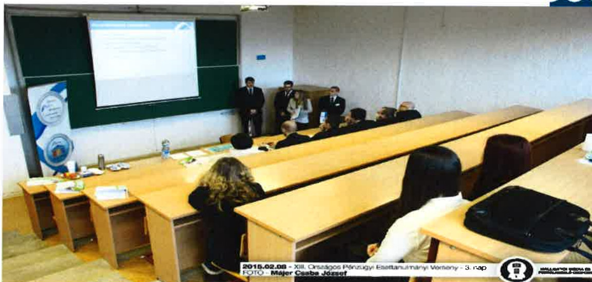
2016.02.08 - XII. Országos Pénzügyi Esettanulmányi Verseny - 3. nap