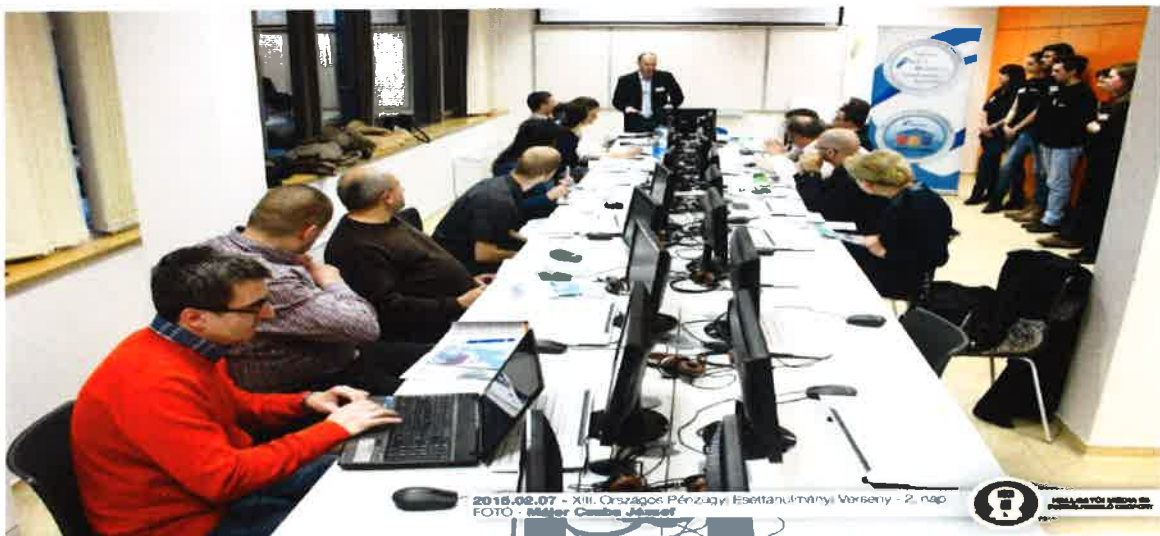
2015.02.07 - XIII. Országos Pénzügyi Esztanulmányi Verseny - 2. nap

PALLAS ATHÉNE DOMUS SCIENTIAE ALAPÍTVÁNY