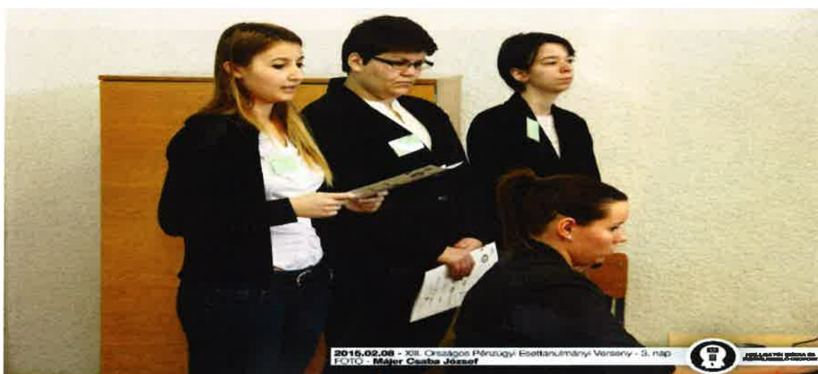
2015.02.08 - XIII. Országos Pénzügyi Esettanulmányi Verseny - 3. nap