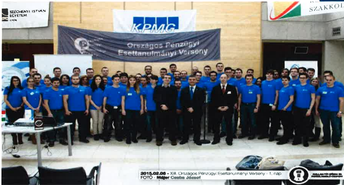
2015.02.06 - XIII. Országos Pénzügyi Esettanulmányi Verseny - 1. nap