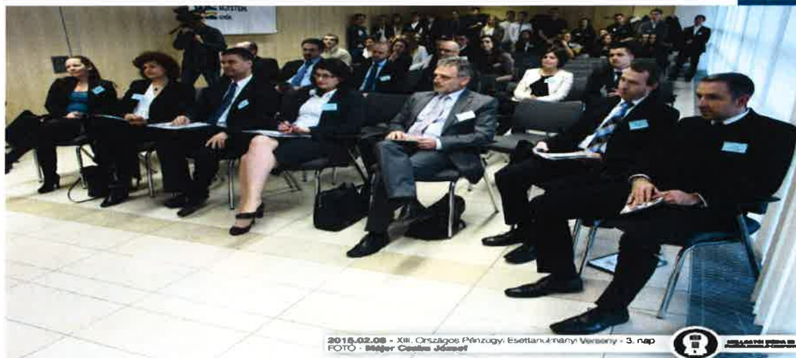
2015.02.08 - XIII. Országos Pénzügyi Esettanulmányi Verseny - 3. nap