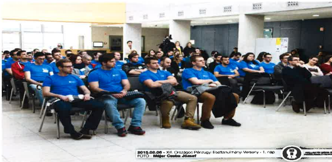
2015.02.06 - XIII. Országos Pénzügyi Esettanulmányi Verseny - 1. nap

2015.02.06. Pénzügyi Esettanulmányi Verseny