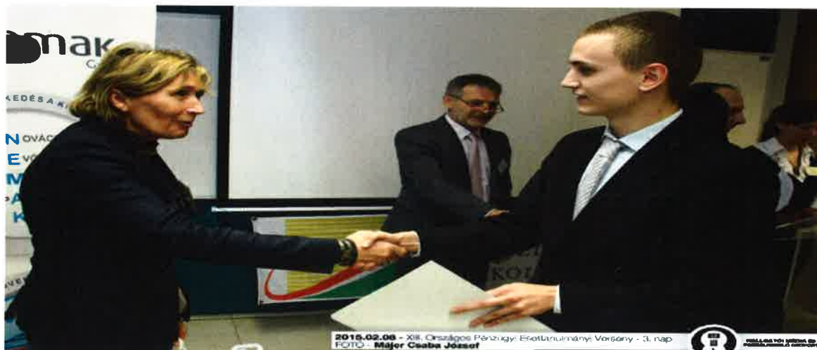
2016.02.08 - XII. Országos Pénzügyi Esettanulmányi Verseny - 3. nap

MAGYAR PÉNZÜGYI ÉS PÉNZÜGYES SZAKMUNKÁSOK PÁLYÁZAT-ÉRTÉKELÉSI BIZOTTSÁGA